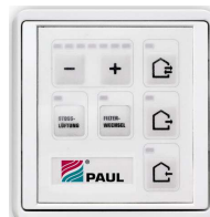
LED regulacija (ŠxVxG v mm: 80x80x12)