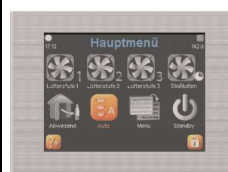
TFT ekran na dotik (touchpanel) barvni (BxHxT in mm: 102x78x14)